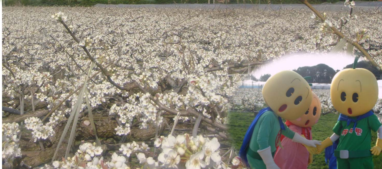
伊万里梨キャラクター (左から) なし万里くん、梨里ちゃん、万梨之助くん