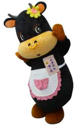
伊万里市マスコットキャラクター 『いまりんモーモちゃん』